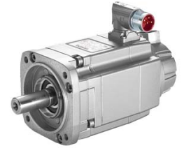
Figura similar / Figure similar