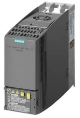
Иллюстрация аналогичная / Figure similar