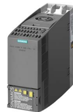
Иллюстрация аналогичная / Figure similar