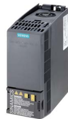
Figura similar Figure similar

Referencia : 6SL3210-1KE13-2AP2 Article No. :