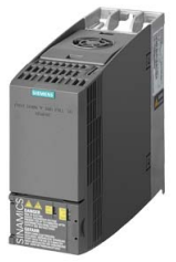
Иллюстрация аналогичная / Figure similar