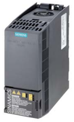
Figura similar Figure similar

Referencia : 6SL3210-1KE13-2UF2 Article No. :