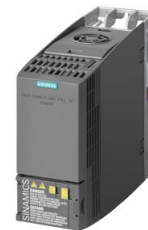
Иллюстрация аналогичная / Figure similar