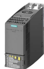
Иллюстрация аналогичная / Figure similar