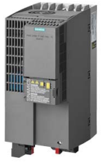
Podobné zobrazení / Figure similar

Č. zakázky zákazníka / Client order no.: