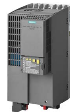
Podobné zobrazení / Figure similar