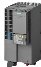
Podobné zobrazení / Figure similar