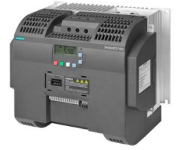
Иллюстрация аналогичная Figure similar

Номер артикула : 6SL3210-5BE31-1UV0 Article No. :