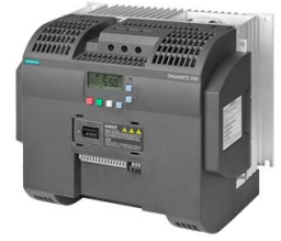
Иллюстрация аналогичная Figure similar

Номер артикула : 6SL3210-5BE31-5UV0 Article No. :