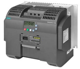
Иллюстрация аналогичная / Figure similar