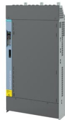
Figura simile Figure similar