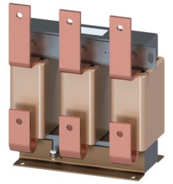
Figura similar / Figure similar

Número de pedido del cliente / Client order no.: