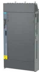
Figura simile Figure similar