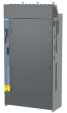
图像类似 / Figure similar