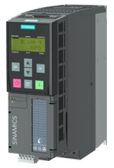
图像类似 / Figure similar