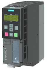
图像类似 / Figure similar