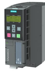
图像类似 / Figure similar