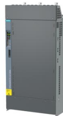
Figura simile Figure similar