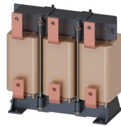
Figura similar / Figure similar

Número de pedido del cliente / Client order no.: