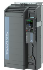
Figura simile Figure similar