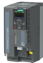
Figura simile Figure similar