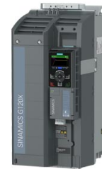
Figura simile Figure similar