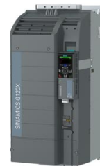
Figura simile Figure similar