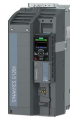
Figura simile Figure similar