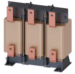
Figura similar / Figure similar

Número de pedido del cliente / Client order no.: