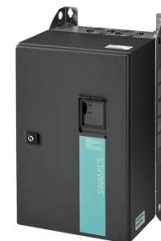
Figura similar Figure similar

Referencia : 6SL3223-0DE33-0AA0 Article No. :