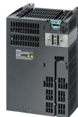
Figura similar Figure similar

Referencia : 6SL3225-0BE27-5AA1 Article No. :